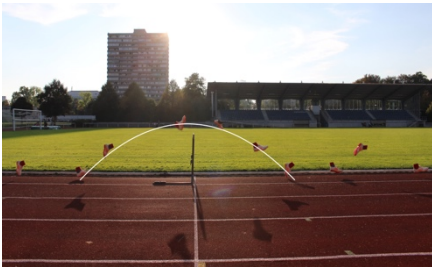
Der perfekte Hürdensprung

Reflexionen auf einer Wasseroberfläche beim Einschlag eines Tropfens (Pius Hafner, 2. Preis)